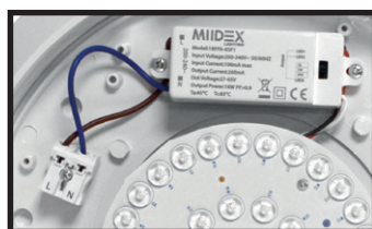
Connecteur rapide double entrée Contrôle CCT à l'intérieur du produit