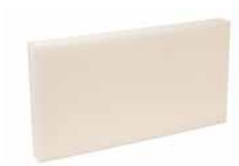
Mousse acoustique D125 mm