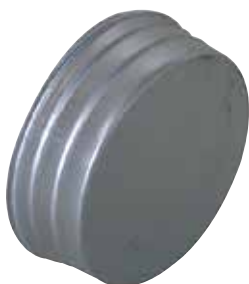
Bouchon Mâle Femelle en aluminium

Le bouchon mâle femelle alu permet de boucher un conduit ou un accessoire en aluminium dans les locaux tertiaires et les logements collectifs.