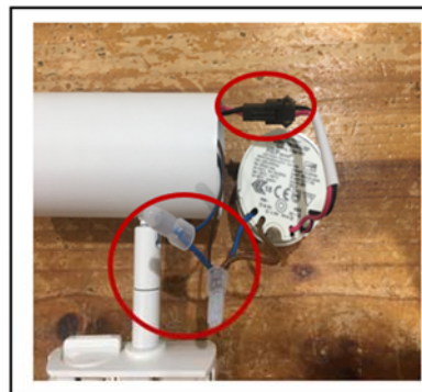
Figure2 Loose the connection