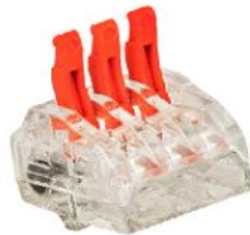
Bornes de connexion: Connecteur à levier