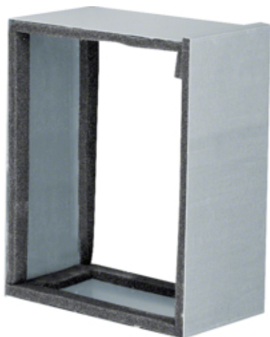
Manchon coulissant, FWK 90/99160, galvan.