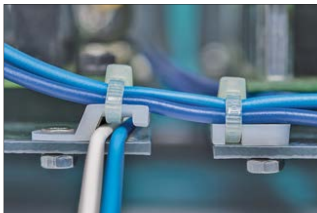
Embases à visser des séries TY et MB, en application.