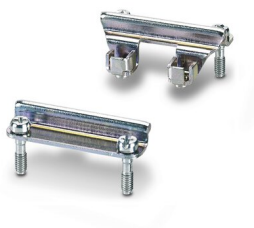
Kit d'adaptation, type: D15

Veillez tenir compte du fait que les données affichées dans ce document PDF proviennent de notre catalogue en ligne. Vous trouverez les données complètes dans la documentation utilisateur. Nos conditions générales d'utilisation des téléchargements sont applicables.