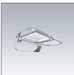
Projecteur LED grands espaces AFP M 48L35-740 EWR HFX CL2 GY 96644891