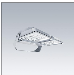
Projecteur LED grands espaces AFP M 48L35-740 EWR HFX CL2 GY 96644891

La présente déclaration de produit environnemental (EPD) est basée selon les normes EN ISO 14025 et EN 15804 et décrit les impacts spécifiques environnementaux du produit mentionné. Cette déclaration fait suite également aux exigences spécifiques et concrètes du programme Institut Bauen und Umwelt e.V. (IBU) selon les règles de calcul des LCA et le contenu de l'EPD (de base) selon les instructions de PCR sous-jacentes (PCR: Règles de catégorie de produit) pour «Luminaires, lampes et composants pour luminaires» (Ref: IBU PCR Teil A et B). Le produit décrit sert d'unité déclarée. La déclaration inclut une description du produit, des informations sur la composition des matériaux, la production, le transport, la phase d'utilisation, l'élimination et le recyclage, ainsi que les résultats de l'évaluation du cycle de vie. Les EPD des produits de construction sont comparables uniquement si les valeurs sont calculées conformément au même PCR et des scénarios d'utilisation appropriés et obligatoires.