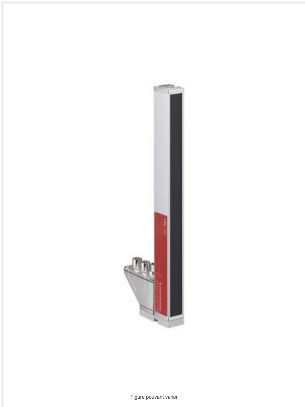
Figure pouvant varier