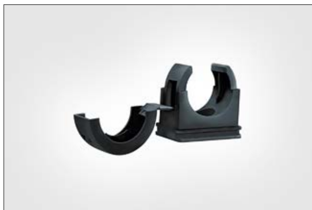
Clip HelaGuard PACC pour gaines annelées.