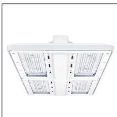
Luminaire industriel à LED CR2PL L35k-840 PM WB LDO WH 42187562