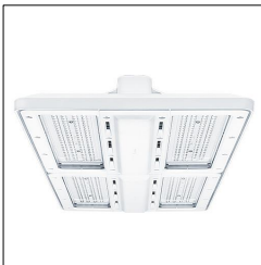
Luminaire industriel à LED CR2PL L35k-840 PM WB LDO WH 42187562

La présente déclaration de produit environnemental (EPD) est basée selon les normes EN ISO 14025 et EN 15804 et décrit les impacts spécifiques environnementaux du produit mentionné. Cette déclaration fait suite également aux exigences spécifiques et concrètes du programme Institut Bauen und Umwelt e.V. (IBU) selon les règles de calcul des LCA et le contenu de l'EPD (de base) selon les instructions de PCR sous-jacentes (PCR: Règles de catégorie de produit) pour «Luminaires, lampes et composants pour luminaires» (Ref: IBU PCR Teil A et B). Le produit décrit sert d'unité déclarée. La déclaration inclut une description du produit, des informations sur la composition des matériaux, la production, le transport, la phase d'utilisation, l'élimination et le recyclage, ainsi que les résultats de l'évaluation du cycle de vie. Les EPD des produits de construction sont comparables uniquement si les valeurs sont calculées conformément au même PCR et des scénarios d'utilisation appropriés et obligatoires.