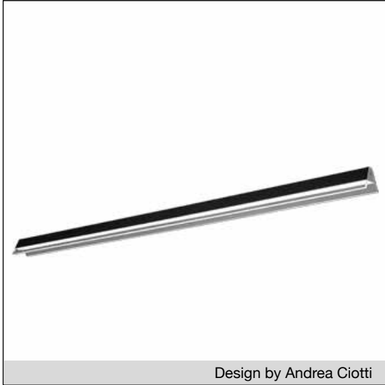
Design by Andrea Ciotti