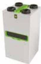
InspirAIR® Top 300 Premium

La solution double flux connectée qui filtre efficacement les polluants les plus fins et s'adapte à vos besoins