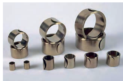
Pince pour collier FS et FT