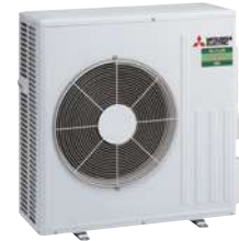
SUZ-M 60 VA