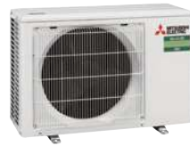
SUZ-M 25/35 VA