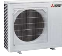
SUZ-M 50 VA