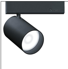
Projecteur d'accentuation à LED SUP2 L LED1250-930 SP LDO 3CY BK 60714979