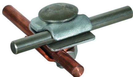
Illustrations sans engagement