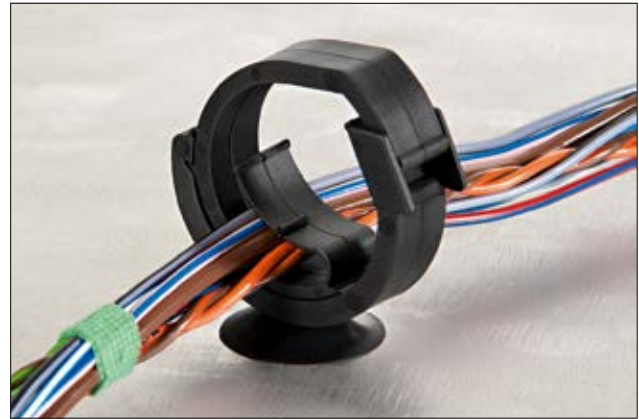
Agrafe automatique de la s rie AHC, fix e au support, en position ferm e.