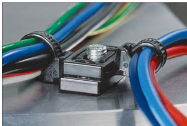
Routage en parallèle, grâce à la superposition de deux lanières T50SOSWSPE-2.