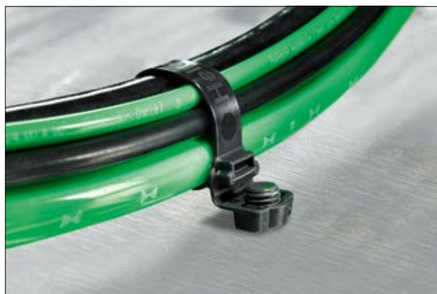
La large bande minimise les marques sur le revêtement souple des câbles.