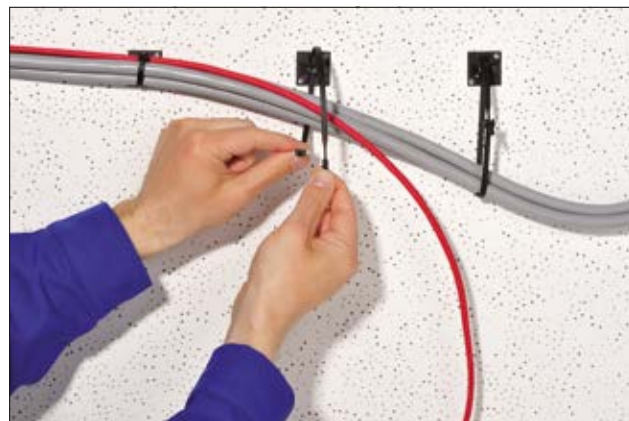
Embases de la série Q en application combinées à un collier de la même série.