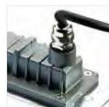
presse-étoupe en laiton nickelé