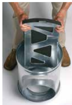
Installation du déflecteur acoustique et aéraulique dans le caisson piquage