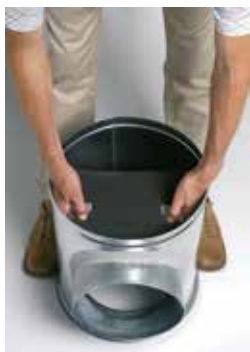
Installation du déflecteur acoustique et aéraulique dans le caisson piquage