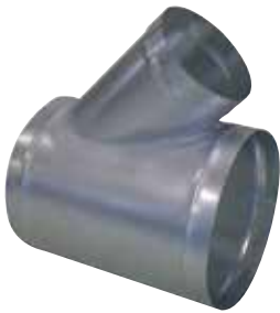
Té Oblique 45°

Le TE 45° permet de raccorder deux branches de réseau galvanisé avec un angle de 45°.