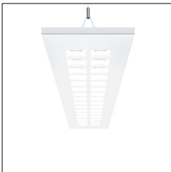
Luminaire suspendu à LED MIRL DI LED5800-830 LDO WH ASQ1 42183048