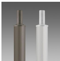
1508 Mât strié Ø 120 avec base