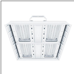
Luminaire industriel à LED CR2 L35k-840 PC WB LDO WH 42187604