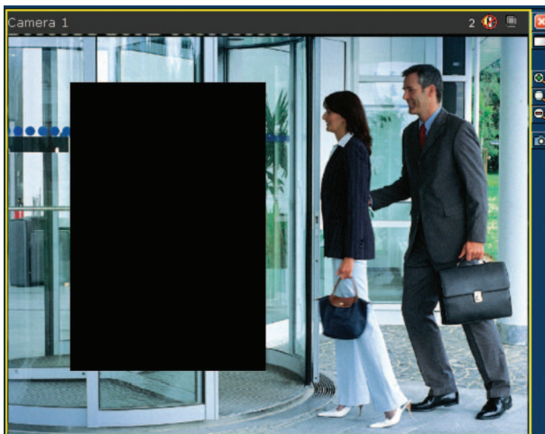
Fig. 3: Zones masquées par la fonction « Privacy Zones » (zones privées)