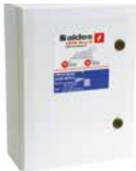
Coffret AXONE fermé, avec interrupteur et 2 pressostats