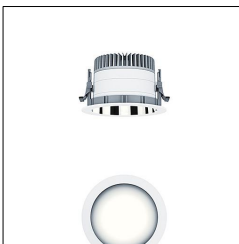
Plafonnier encastré à LED P-INF R150H LED1000-930 LDO AL WH 60818043

La présente déclaration de produit environnemental (EPD) est basée selon les normes EN ISO 14025 et EN 15804 et décrit les impacts spécifiques environnementaux du produit mentionné. Cette déclaration fait suite également aux exigences spécifiques et concrètes du programme Institut Bauen und Umwelt e.V. (IBU) selon les règles de calcul des LCA et le contenu de l'EPD (de base) selon les instructions de PCR sous-jacentes (PCR: Règles de catégorie de produit) pour «Luminaires, lampes et composants pour luminaires» (Ref: IBU PCR Teil A et B). Le produit décrit sert d'unité déclarée. La déclaration inclut une description du produit, des informations sur la composition des matériaux, la production, le transport, la phase d'utilisation, l'élimination et le recyclage, ainsi que les résultats de l'évaluation du cycle de vie. Elle est vérifiée par un organisme indépendant indépendamment conformément à la norme EN ISO 14025. Les EPD des produits de construction sont comparables uniquement si les valeurs sont calculées conformément au même PCR et des scénarios d'utilisation appropriés et obligatoires.