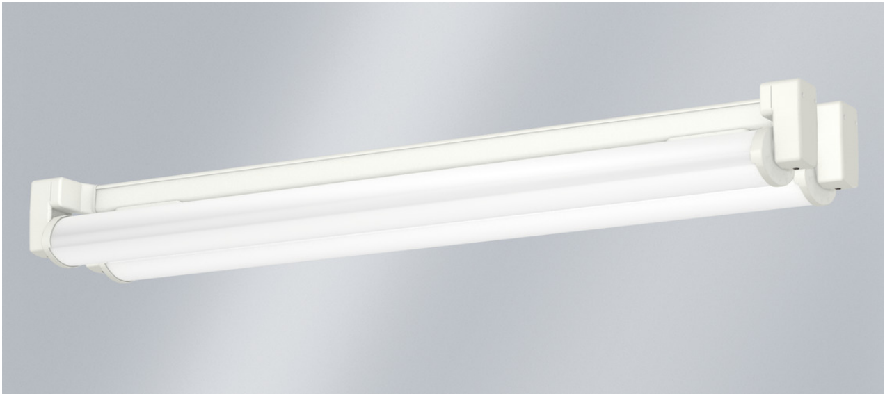
Abb. ggf. abweichend