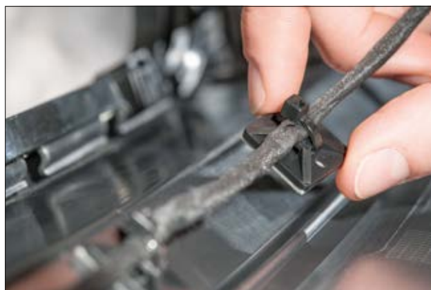
Embases carrées version SolidTack de la série MB en application.