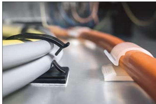
Embases adhésives de la série RB (RB20: à gauche / RB14: à droite), en application.