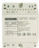
F04802 ALIMENTATION DIN4 230VAC/12VAC-1A