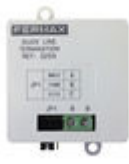
F03255 FIN LIGNE DUOX PLUS