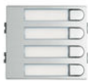
F07367 4 BP. 104 W VDS/BUS2 SKYLINE