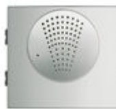
F73902 AMP. AUD. DUOX PLUS SKYLINE W