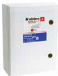
Coffret AXONE Démarrage progressif 1 Vitesse (25,4 A).

AXONE Micro III 1V/DES - D.PROG est un coffret de relaying précâblé et certifié NF permettant de piloter des ventilateurs de désenfumage.