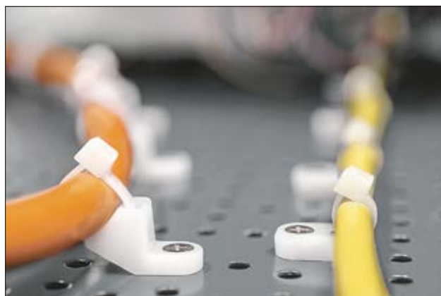
Embases à visser LKM, CL8 et FH, en application.