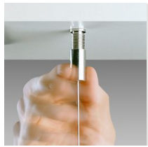
Suspension simple acier