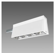
Sintesi Spot - UGR<22 - module luminaireux