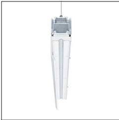
Réglette à LED pour chemin lumineux TECTON C LED3700-830 L1000 WW LDE WH 42183292