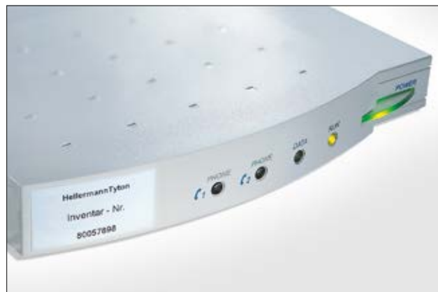
Étiquettes pour une identification permanente des immobilisations.