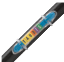
0 384 56 avec repères et capot de protection réf. 0 384 97