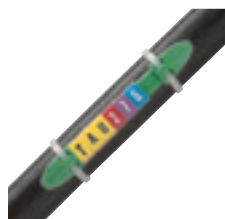
Repérage ouvert avec porte-repères réf. 0 384 55