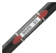
0 384 52 avec étiquette et porte-étiquette réf. 0 384 98