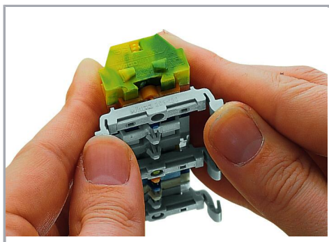
Barrette à bornes avec pieds de fixation à encliqueter