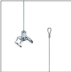
Suspension à câble TECTON/CONTUS ASI5 O-L LOOP 22170956