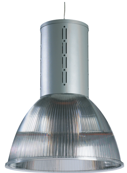
Rails standards ou dimmables