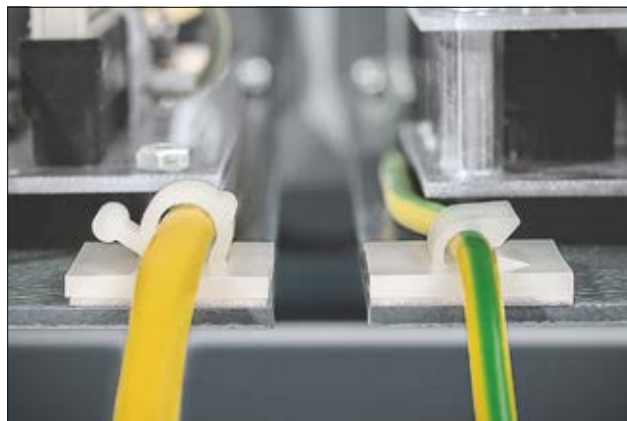
Clips adhésifs des séries RA et RB (RA6: à gauche / RB5: à droite), en application.