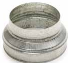
Réduction Conique Concentrique

La RCC permet de raccorder deux conduits galvanisés de diamètres différents entre eux.