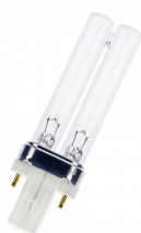
FTC07G23GERM/01 Germicidal G23 7W UVC TUVPLS7