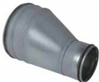
Réduction Conique Excentrée à joints

La RCE à joints permet de raccorder deux conduits galvanisés de diamètres différents entre eux tout en assurant une étanchéité classe C.