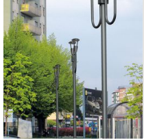
1491 Mât à enterrer