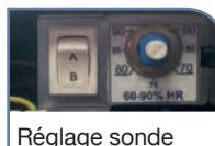
Réglage sonde hygro + ajustement du nombre de sanitaires