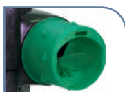
Piquage sanitaire calibré Ø 80 mm