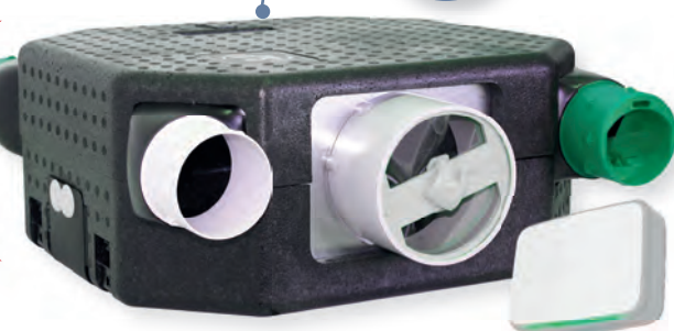
Sonde de Qualité d'Air Intérieure