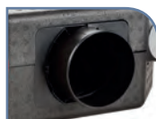
Piquage de rejet Ø 125 mm