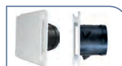
Kit livré avec 3 bouches design extra-plates