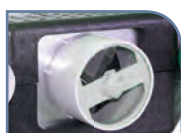
Piquage cuisine Ø 125 mm avec sonde