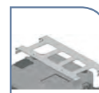
Platine de fixation