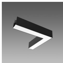
Module d'angle - PLEINE INTENSITÉ - plafond